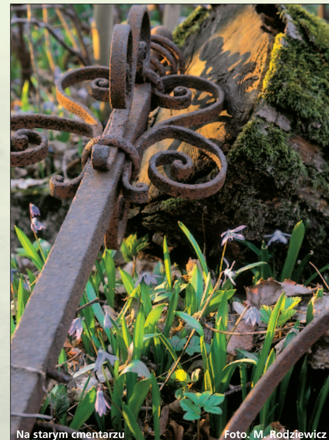
Na starym cmentarzu