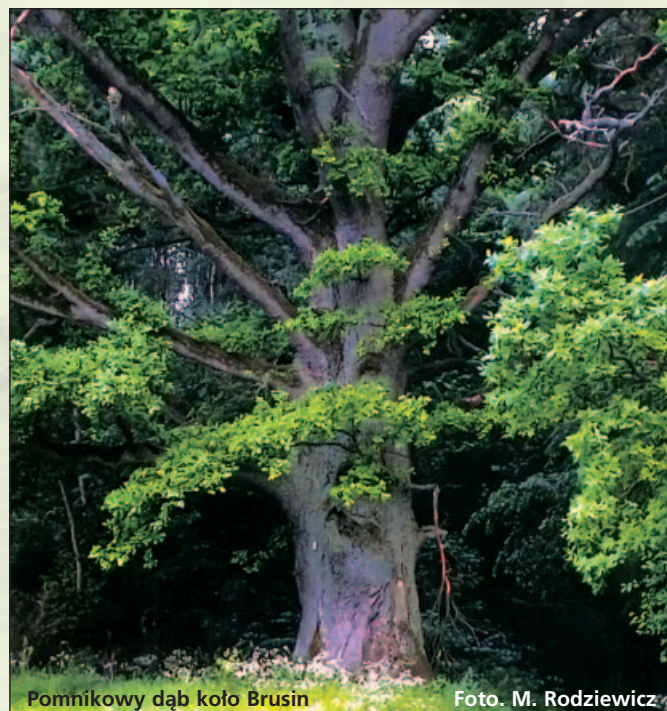
Pomnikowy dąb koło Brusin

Iława-Mitomłyn - Ostróda - Elbląg - Zalew Wiślany) oraz głównych, położonych obrzeżnie, drogowych i kolejowych szlaków turystyki krajoznawczej. Park Krajobrazowy Pojezierza Iławskiego stanowi integralny, ważny element obszaru funkcjonalnego jakim są Zielone Płuca Polski, będąc jednocześnie granicą i bramą zachodnią tego jedyne w swoim rodzaju obszaru w Europie.