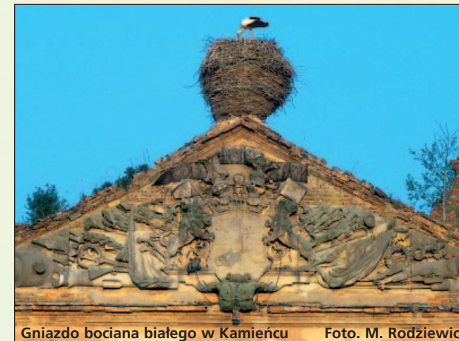
Gniazdo bociana białego w Kamieńcu