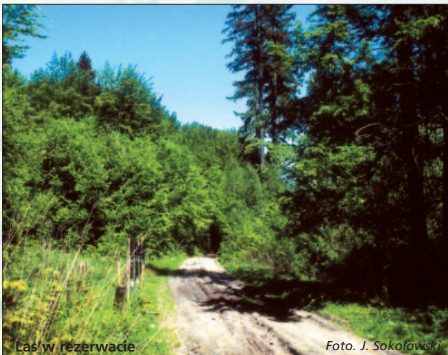
Las w rezerwacie