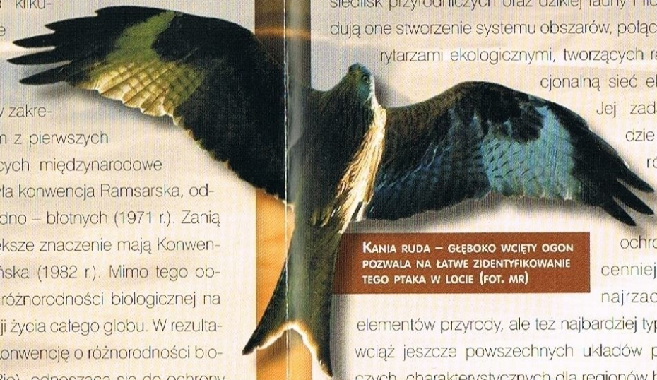
KANIA RUDA – GŁĘBOKO WCIĘTY OGON POZWALA NA ŁATWE ZIDENTYFIKOWANIE TEGO PTAKA W LOCIE

Wraz z dynamicznym rozwojem gospodarczym Europy w ostatnim stuleciu, przyroda całego kontynentu stała się coraz bardziej zagrożona. Od kilku-dziesięciu lat podejmowane były próby skoordynowania na drodze prawnej wysiłków różnych krajów europejskich w zakresie ochrony przyrody. Jednym z pierwszych znaczących aktów określających międzynarodowe normy w ochronie przyrody była konwencja Ramsarska, odnosząca się do obszarów wodno – błotnych (1971 r.). Z nią przyszły inne, z których największe znaczenie mają Konwencja Bońska (1979 r.) i Berneńska (1982 r.). Mimo tego obserwowano zmniejszenie się różnorodności biologicznej na różnych poziomach organizacji życia całego globu. W rezultacie, w 1992 roku podpisano Konwencję o różnorodności biologicznej (tzw. konwencję w Rio), odnoszącą się do ochrony całego bogactwa przyrodniczego Ziemi. Celem tej konwencji jest ochrona różnorodności biologicznej, zrównoważone wykorzystanie jej elementów i gospodarowania nimi, a także sprawiedliwy podział korzyści czerpanych z zasobów genetycznych