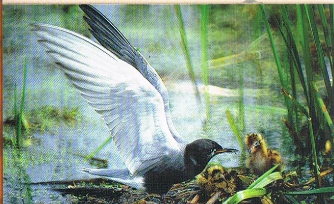
RYBITWA CZARNA – ZAKŁADA KOLONIE LĘGOWE NA PŁYTKICH, ZARASTAJĄCYCH I ZACISZNYCH WODACH