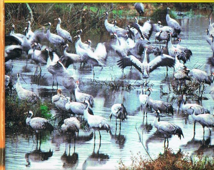
ŻURAW – JEDEN Z NAJWIĘKSZYCH POLSKICH PTAKÓW