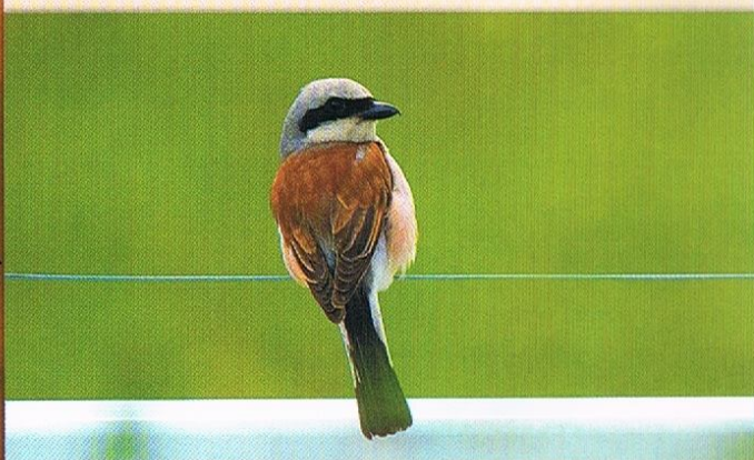
GĄSIOREK – JEST PTAKIEM ŚPIEWAJĄCYM, NIECO WIĘKSZYM OD WRÓBLA, GNIAZDUJE W CIERNISTYCH KRZEWACH