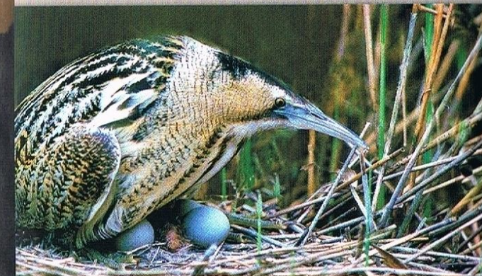
BĄK – ZACISZNE TRZCINOWISKA SĄ ŚRODOWISKIEM JEGO ŻYCIA

W najbliższym czasie planuje się powołanie na terenie naszego województwa nowych obszarów Natura 2000 w ramach „Dyrektywy Siedliskowej”. Dwa z projektowanych obszarów tj. „Ostoja Iławska” i „Aleje Pojezierza Iławskiego” znajdować się będą w granicach Parku Krajobrazowego Pojezierza Iławskiego oraz w Obszarze Chronionego Krajobrazu Pojezierza Iławskiego.