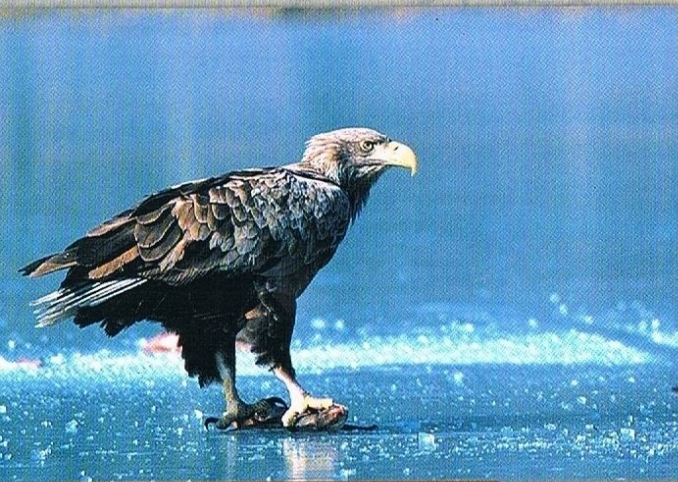
BIELIK – NAJWIĘKSZY POLSKI PTAK DRAPIEŻNY

Na terenie Parku Krajobrazowego Pojezierza Iławskiego rozporządzeniem Ministra Środowiska z dnia 21 lipca 2004 roku w sprawie obszarów specjalnej ochrony ptaków Natura 2000 wyznaczono obszar pod nazwą „Lasy Iławskie” (kod obszaru PLB 280005). Granice tego obszaru pokrywają się z granicami powołanego w 1993 roku Parku Krajobrazowego Pojezierza Iławskiego. Zgodnie z rozporządzeniem celem wyznaczenia obszarów jest ochrona populacji dziko występujących ptaków oraz utrzymanie ich siedlisk w niepogorszonym stanie. Przedmiotem ochrony są gatunki ptaków wymienione w załączniku nr I Dyrektywy Ptasiej.