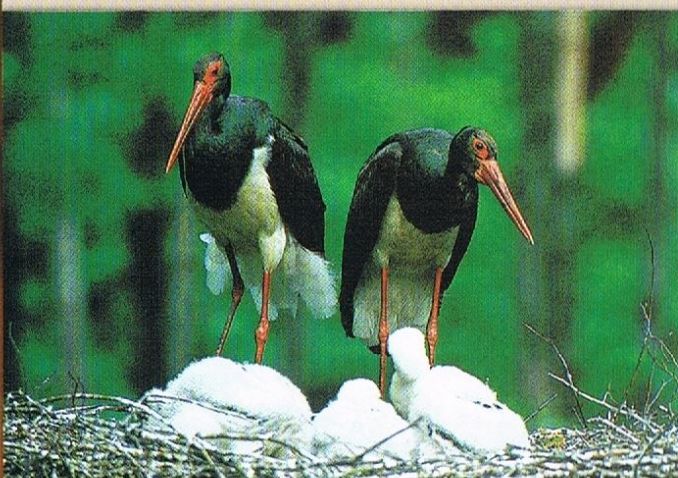
BOCIAN CZARNY – ZAMIESZKUJE ROZLEGŁE LASY W POBLIŻY ZBIORNIKÓW WODNYCH