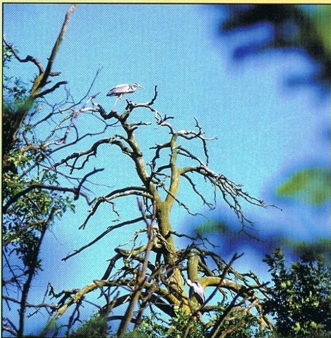
Czapla siwa w kolonii kormoranów

Wkraczającemu w obręb kolonii intruzowi spada na głowę deszcz płynnych odchodów zaniepokojonych ptaków, a z potraconych gałęzi sypie się biały pył odchodów wysuszonych. Z gościnności kormoranów korzystają czaple siwe zjadając z ziemi ryby, które podczas karmienia młodych często wypadają kormoranom z dziobów. Czaple osiedliły się na obrzeżach kolonii budując tam swoje gniazda. Przy dużym szczęściu na wierzchołkach suchych