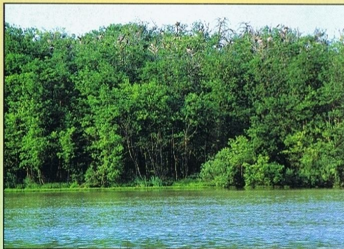
Widok na kolonię

Życząc miłych doznań zapraszamy do odwiedzenia pozostałych rezerwatów Parku Krajobrazowego Pojezierza Iławskiego.