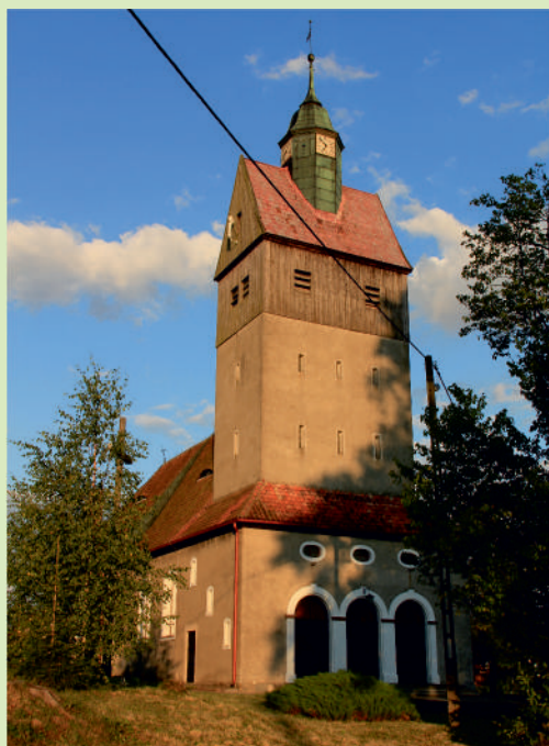
▲ Kościół w Marwałdzie.