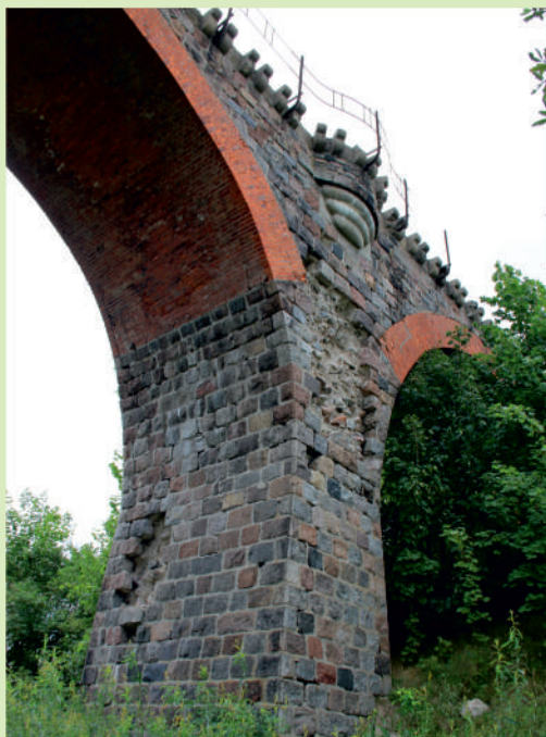
▲ Wiadukt w Glaznotach.