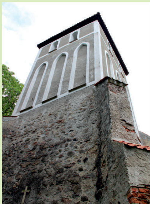
▲ Kościół w Glaznotach.