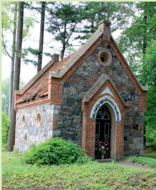
▲ Kaplica grobowa Kramerów w Zajączkach.