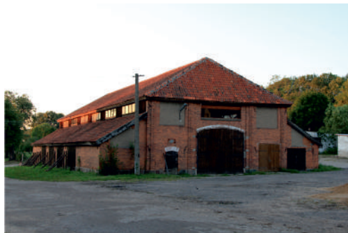
Fot. Zachowany budynek gospodarczy dawnego majątku w Zajączkach.

Nad wejściem do kaplicy widnieje napis: „Selig sind die Toten die in dem Herren Sterben” ( Błogosławieni umarli, którzy w Panu umierają ). W kaplicy znajduje się 11 ocynkowanych trumien oraz trzy urny.