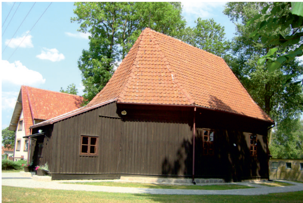
Fot. Pietrzwałd – barokowy kościół z dobudowaną w późniejszym okresie zakrytą od wschodu oraz przedsiönkiem od zachodu.

Na początku XX w., ze względu na stan techniczny kościoła, dokonano jego rozbiórki, a w 1924 r. – rekonstrukcji. W 1980 r. kościół został odrestaurowany.