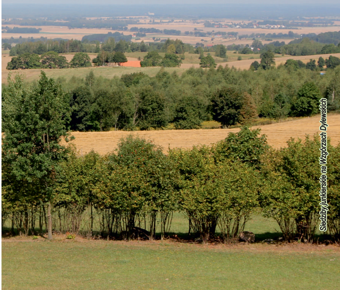
Siedziby jankierskie na Wzgórzach Dylewskich