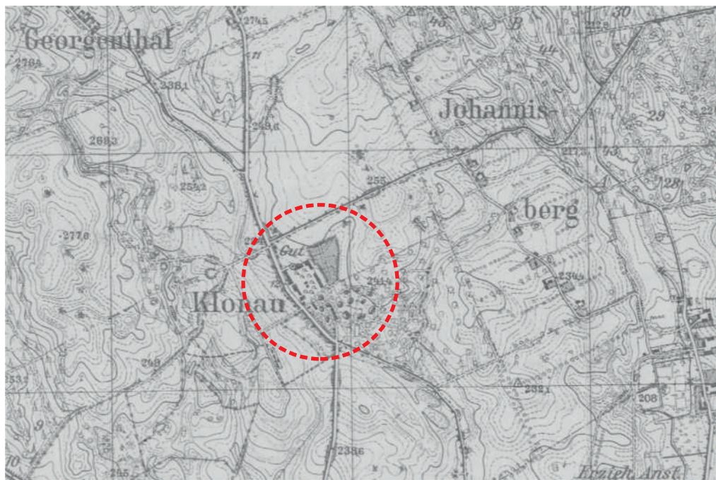
Ryc. Majątek Klonowo (niem. Klonau) – na archiwalnej mapie z 1944 r..

Pałac założony jest na planie prostokąta, z elewacją frontową zwróconą w kierunku południowo-zachodnim. W części głównej budynek jest dwukondygnacyjny, z charakterystyczną wieżą widokową od północy. Podpiwniczony. W latach późniejszych budynek był rozbudowywany. W sąsiedztwie pałacu, od wschodu i południa rozciąga się ponad 130-letni park (20 ha).