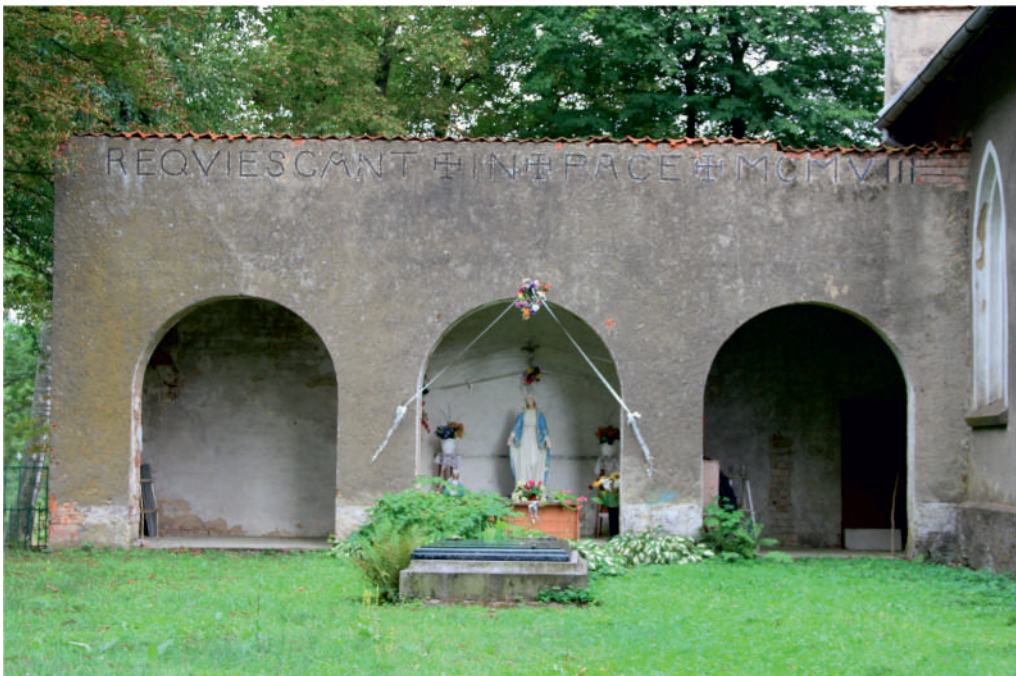
Siedziby junkierskie na Wzgórzach Dylewskich