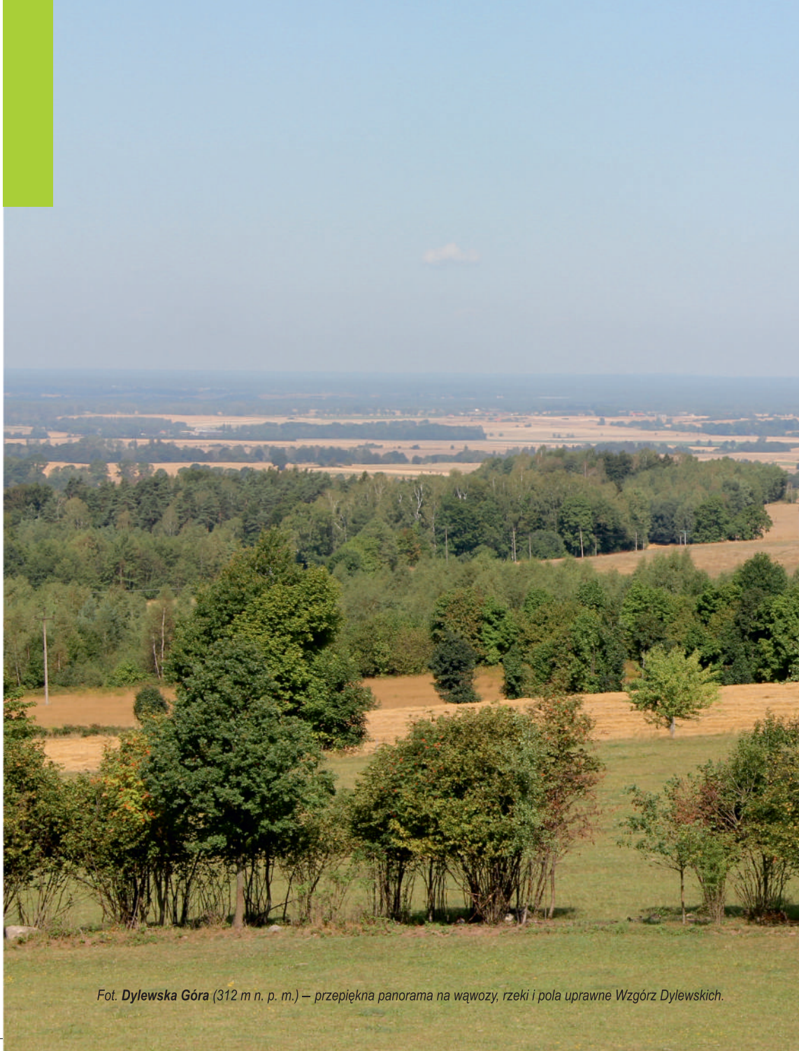
Fot. Dylewska Góra (312 m n. p. m.) – przepiękna panorama na wąwozy, rzeki i pola uprawne Wzgórz Dylewskich.