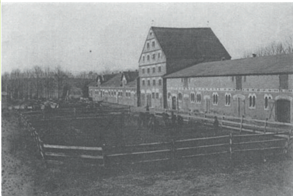
Fot. Nieistniejący już budynek gospodarczy folwarku w Dylewie.