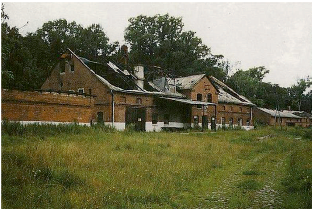
Fot. Dylewo – nieistniejące już budynki folwarczne z 2 poł. XIX w. (Źródło: [a:] http://dylewo-dohlau.pl/tl/Maj%26%23261%3Btek-ziemski-oraz-zabudowania-gospodarcze.htm ).