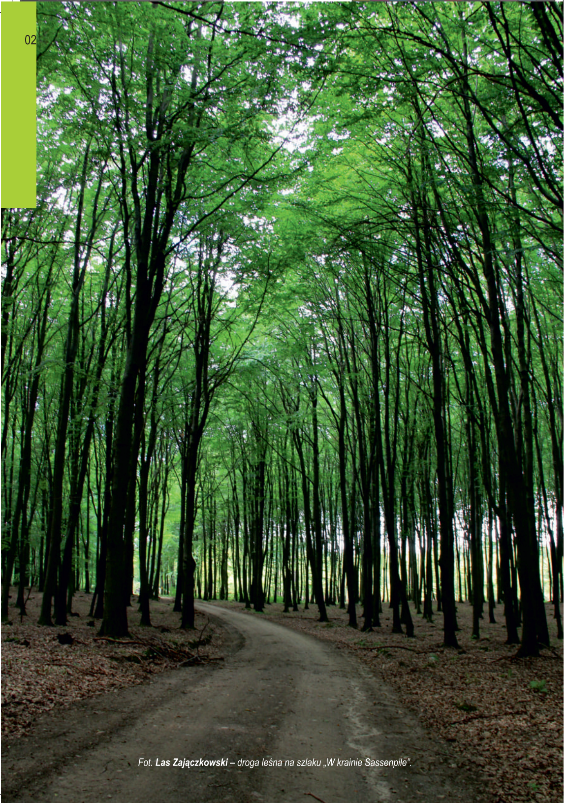
Fot. Las Zajązkowski – droga leśna na szlaku „W krainie Sassenpüle”