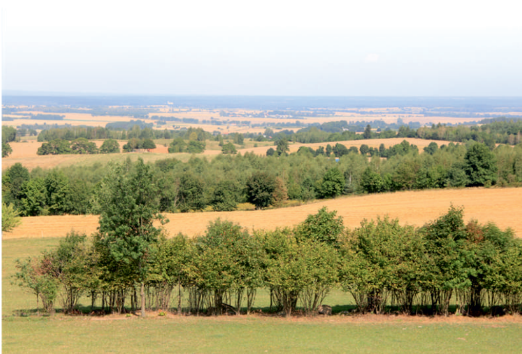
Fot. Dylewska Góra (312 m n. p. m.) – widok z wieży widokowej na szlaku „Siedziby junkierskie na Wzgórzach Dylewskich”.

Serdecznie zapraszamy wszystkich miłośników aktywnego spędzania czasu do odwiedzenia Parku Krajobrazowego Wzgórz Dylewskich!