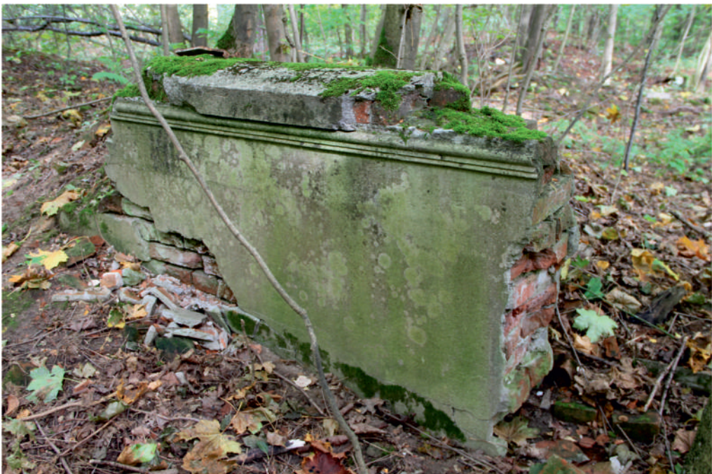
Fot. Gardzien — obecnie w miejscu, gdzie stał pałac można odnaleźć tylko jego nieliczne szczątki .