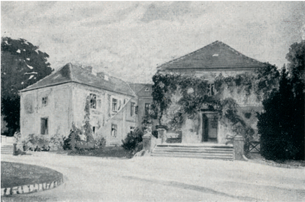
Fot. Pałac w Gardzieniu w latach około 1925-1942.