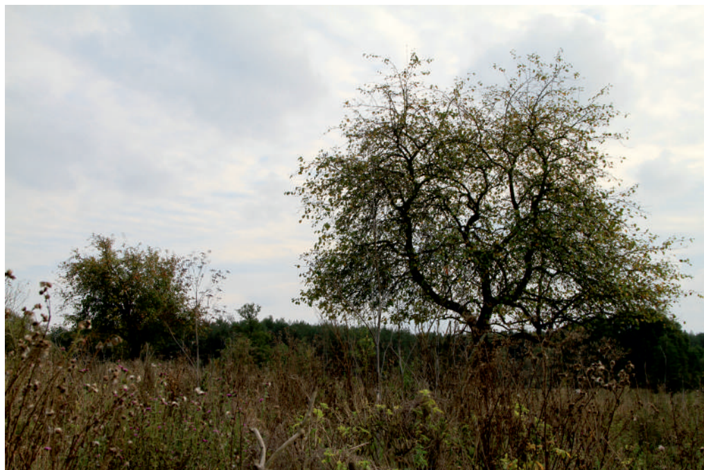
III. Hawski Biskupin

Od k. XIX w. do produkcji szkła zaczęto wykorzystywać potaż syntetyczny, co spowodowało zanikanie leśnych hut szkła, a tym samym zahamowanie ogromnych wycinek lasów.