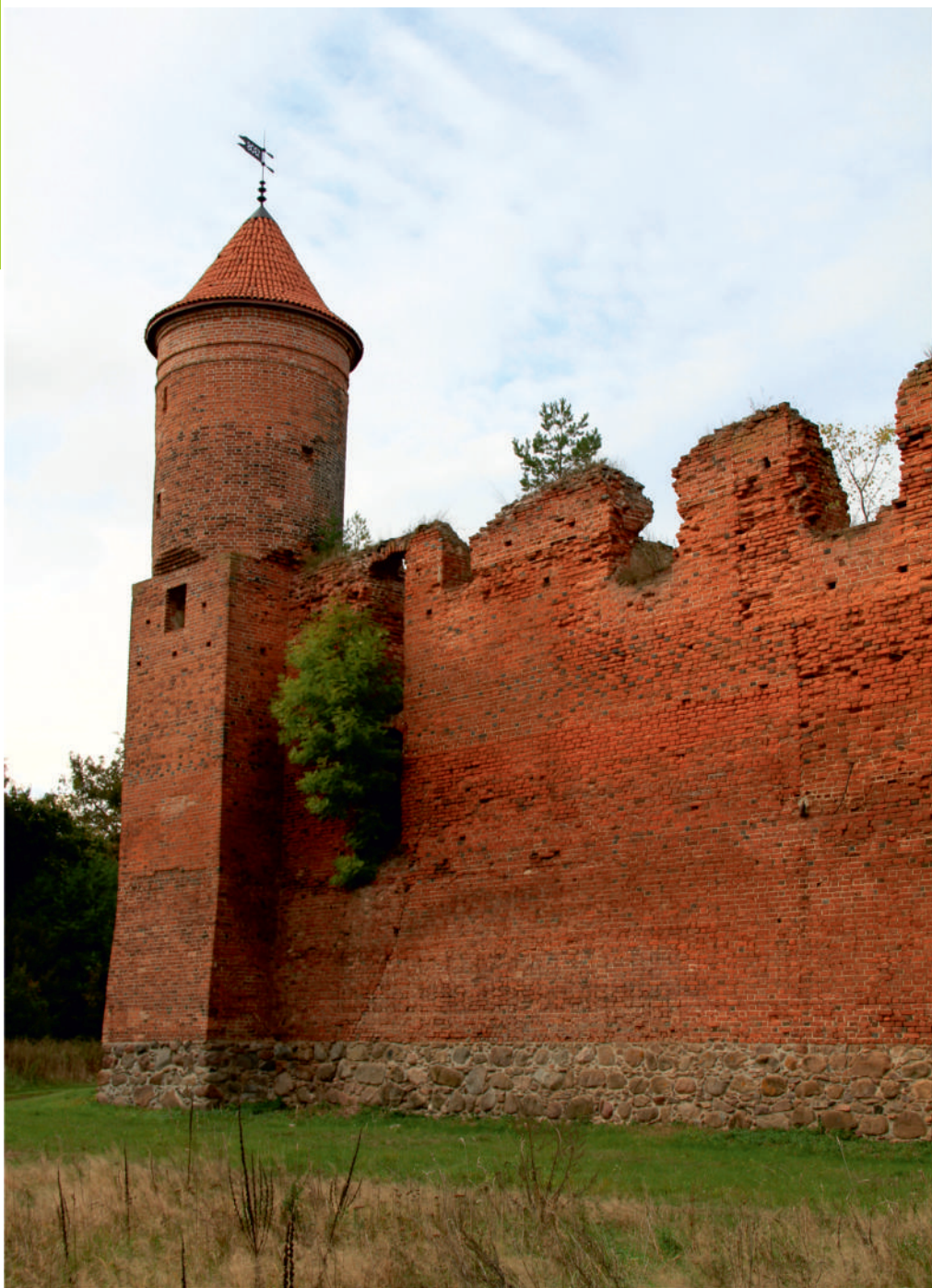
Fot. Jedna z wież zamku w Szymbarku.