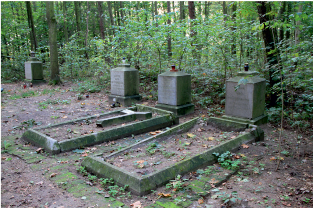
III. HAWSKI BISKUPIN