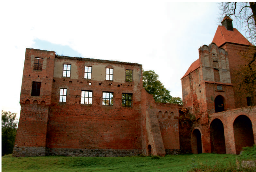
III. Iławski Biskupin

Majątek Szymbark w posiadaniu rodu Finckensteinów pozostawał do 1905 r.