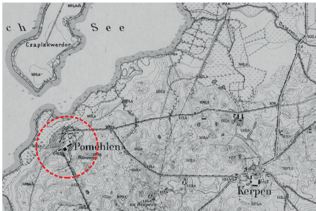
Ryc. Majątki Pomielin (niem. Pomehlen) oraz Karpowo (niem. Kerpen) – na archiwalnej mapie z 1920 r..

W rejonie półwyspu i wyspy Czaplak stwierdzono występowanie wielu rzadkich i zagrożonych gatunków zwierząt m. in. strumieniówki, podróżniczka czy kropiatki.