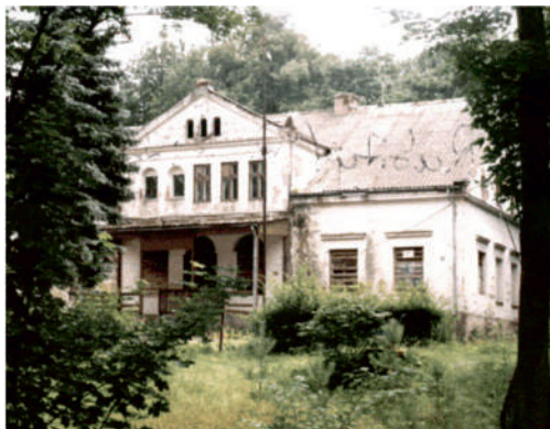
Fot. Dwór w Rąbitach – na zdjęciach archiwalnych.