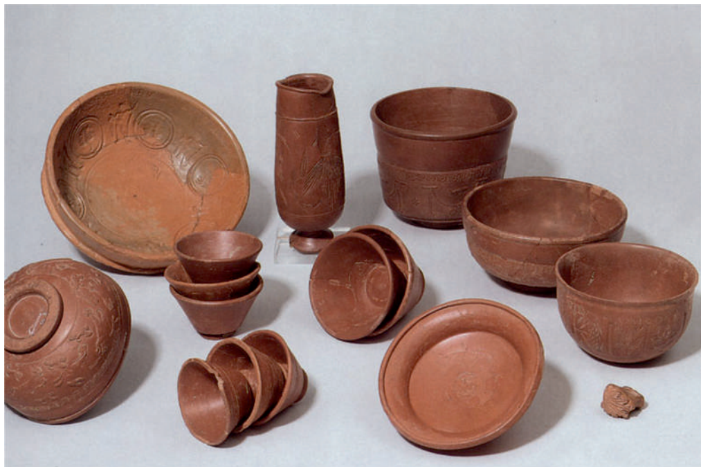
I. Śladami Elisabeth Lemke

Systematyka naczyń typu „terra sigillata” liczy 55 typów podstawowych i ponad 1000 znanych nazw warsztatów oraz imion garncarzy.