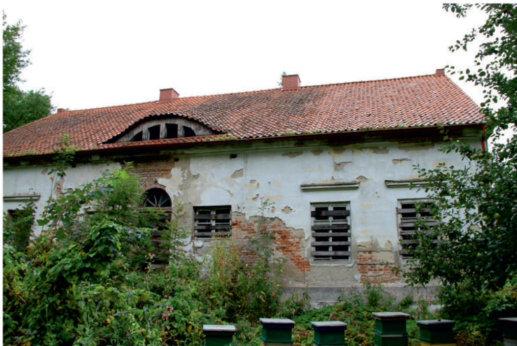
Fot. Dwór w Rąbitach – widok od strony dawnego parku.