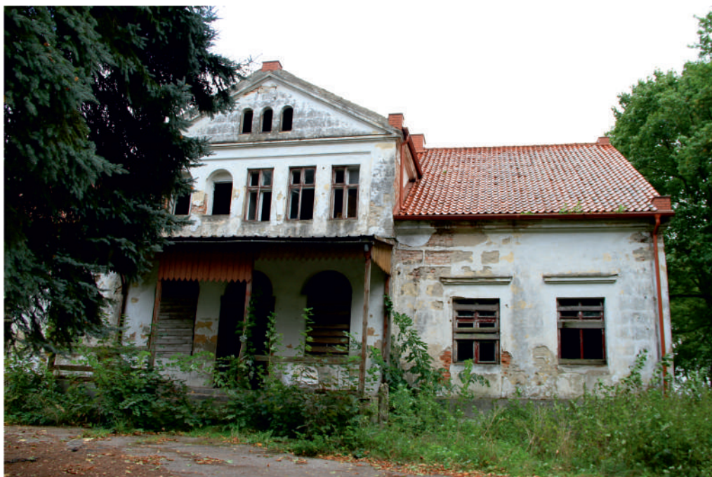
Fot. Dwór w Rąbitach – widok od strony frontowej.