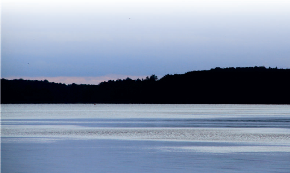
Fot. Jezioro Jeziorak – na szlaku „Śladami Maxa Toeppena”.

Serdecznie zapraszamy wszystkich miłośników aktywnego spędzania czasu do odwiedzenia Parku Krajobrazowego Pojezierza Ławskiego!